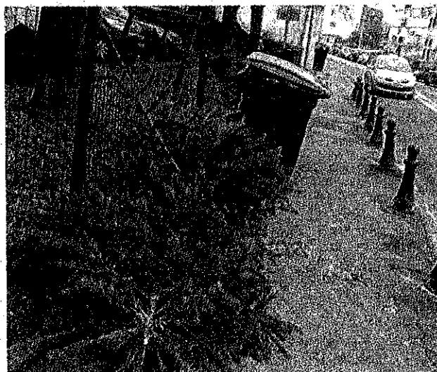
Le but de cette opération est d'éviter les dépôts sauvages de sapins sur les trottoirs.