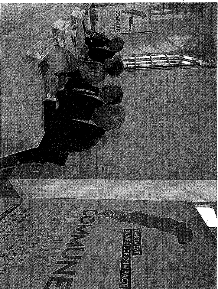
Les quatre maires ont décidé de passer à la phase 2 du projet de création de la commune nouvelle et de lancer la concertation en direction des habitants.

Une première étape s'est close par l'organisation, dans les quatre villes, le lundi 14 mai, de commissions municipales réunissant l'ensemble des élus pour se positionner sur la suite à donner en répondant à plusieurs questions à laquelle cette étude devait apporter des réponses. « La première était « est-il intéressant de faire une commune nouvelle ? », la réponse à l'évidence était oui. Mais, la seconde à laquelle nous de-